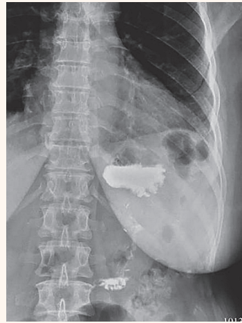
Рис. 3. Контрольная рентгенография с водорастворимым контрастным препаратом демонстрирует оптимальное уменьшение объема желудка и свободное прохождение контрастного вещества через зону гастропликации без выхода за пределы желудка.

Fig. 2. Endoscopic image of the upper third of the body of the stomach: the middle third of the body and the antral part of the stomach are sutured with 5 "U-shaped" endoluminal sutures.