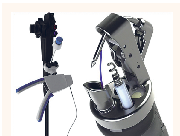
Рис. 1. Специальное устройство для наложения швов Apollo Overstitch™.

Во всех случаях для равномерного уменьшения объема желудка применялся наиболее эффективный «П-образный» вариант шва с наложением 8–10 стежков,