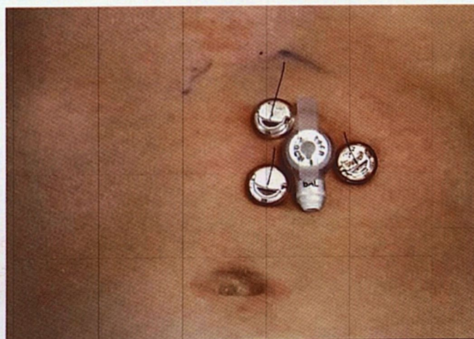
Рис. 7. Гастростомическая трубка установленная на переднюю брюшную стенку у ребенка – осмотр через трое суток после операции