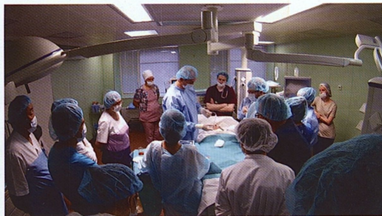
Рис. 6. Прикрепление удлинителя MIC-KEY для питания через универсальный питательный адаптер