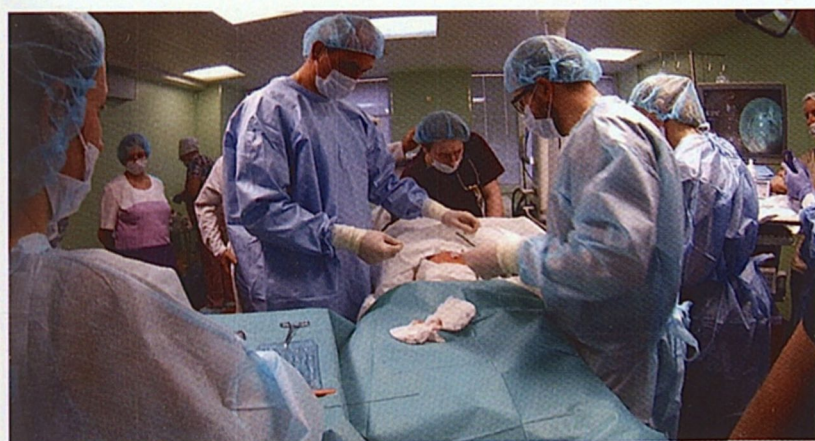
Рис. 5. Обработка области установленной гастростомы